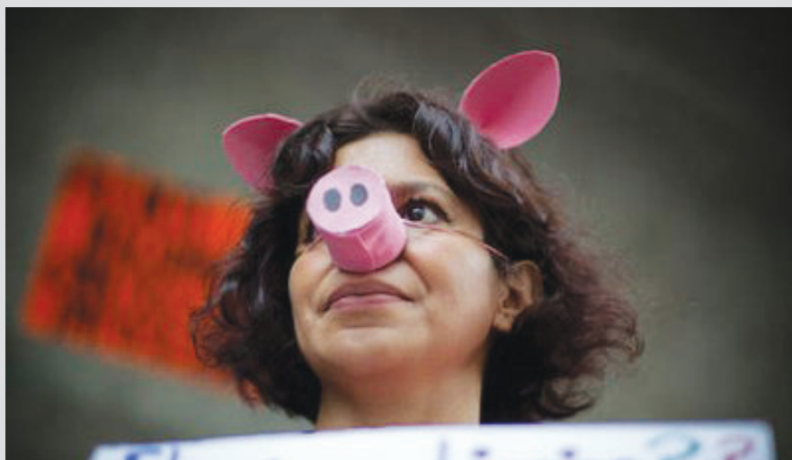
México, DF. Integrantes del Frente Nacional contra la Imposición, protestan frente al Tribunal Electoral del Poder Judicial de la Federación, quienes exigen se anule la elección presidencial del 1 de julio.