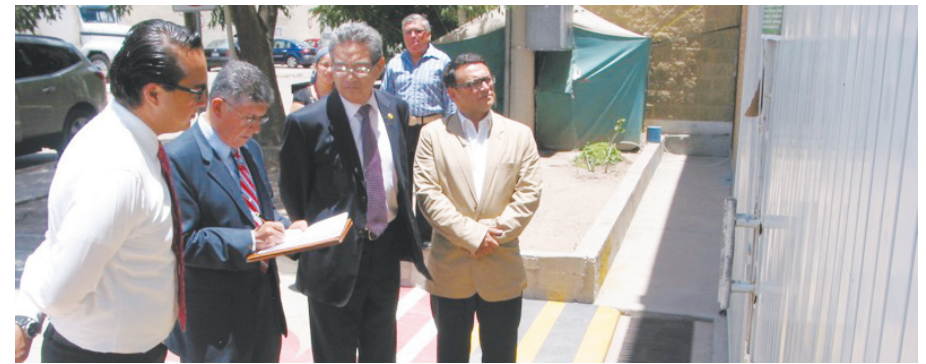
La Sebideso reabre bodega donde se resguardaban todos los apoyos sociales