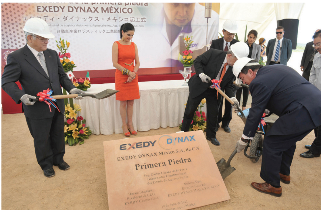
Indicó Lozano que originalmente el proyecto era una inversión reducida, pero aumentó debido a que les ha ido bien en Aguascalientes

Finalmente, el gobernador prometió a los inversionistas y directivos de la empresa japonesa que el PILA estará concluido a tiempo, con toda la infraestructura y servicios que necesita para garantizar el buen funcionamiento de todas las plantas que en él se instalen. “En unos meses veremos esto con calles, electricidad, agua, drenajes y buen número de empresas filiales de Nissan”.