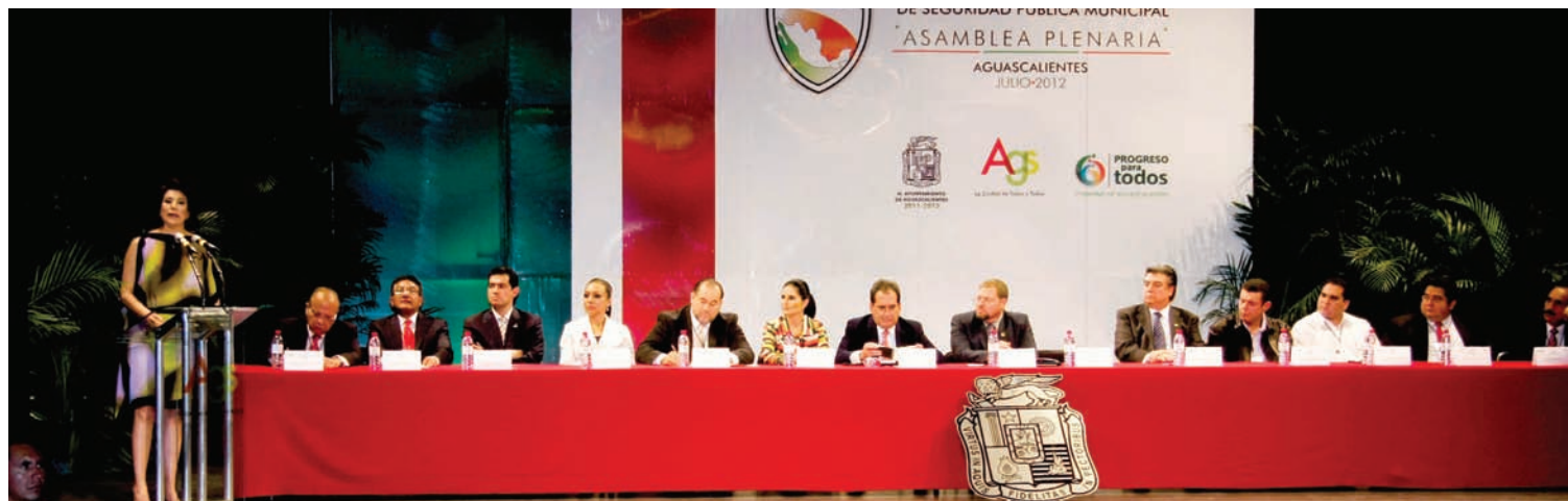
Lozano instó a los 64 alcaldes a volcarse en la realización de estrategias a largo plazo para resolver los conflictos de México

guridad pública no reconoce etiquetas políticas”, por lo cual los recursos deben ser suministrados conforme a necesidades específicas.