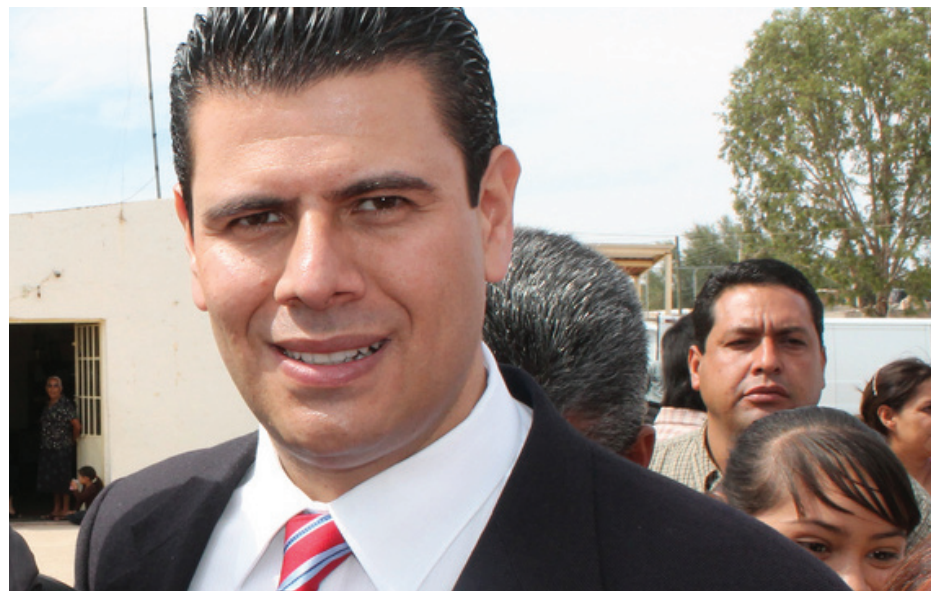
Miguel Alonso Reyes, gobernador de Zacatecas