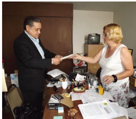
Se busca que se reconozcan aproximadamente 8 mil votos cruzados para los partidos PRI-PVEM ■ Foto PRI

Tras el conteo distrital de la elección a diputado federal realizada en días anteriores, y mediante la cual se contó cada una de las boletas, se detectaron alrededor de 8 mil votos que encuadrarían en esta confusión generada entre el electorado, razón por la cual se pide se tome en cuenta el "verdadero sentir del elector" al momento de emitir su sufragio y no simplemente se tomen como votos nulos.