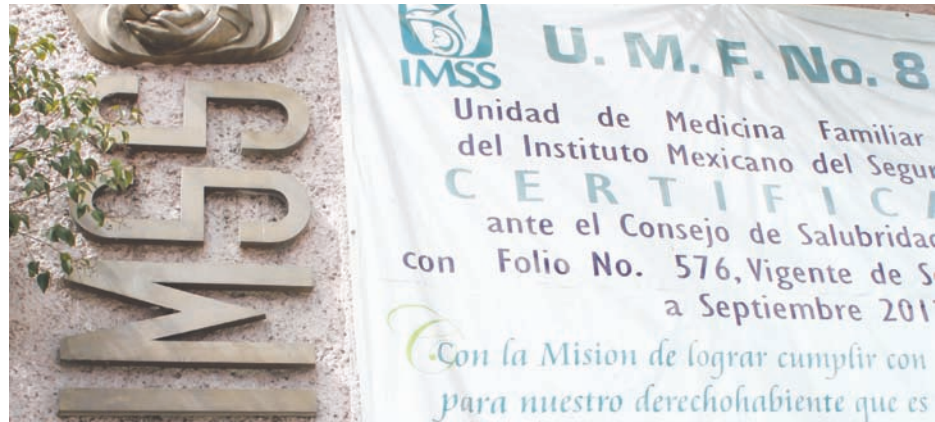
En espera del dictamen del juez primero de distrito del estado

El detenido quedó interno en el Centro de Reinserción Social para Varones, de Aguascalientes, a disposición del juez en mención quien procederá a dictar el auto de término constitucional que conforme a derecho proceda.