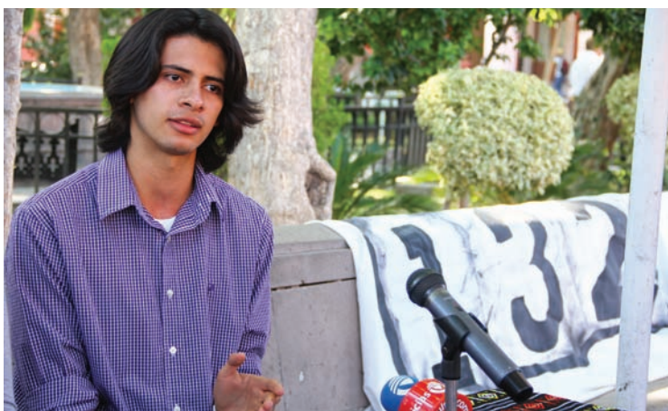
“No seremos parte de la simulación, de que aquí no pasa nada y de que vivimos en un cuento de hadas ” ■ Fotos Roberto Guerra