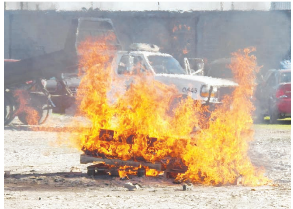
La quema de la droga se realizó dentro de las instalaciones de la PGR de la entidad

La quema se realizó en las instalaciones de la Delegación de la PGR de la entidad, en presencia de autoridades de la XIV Zona Militar, de la Policía Federal Ministerial; del Ministerio Público Federal; y, de un representante del Órgano Interno de Control de la dependencia, quien dio fe del peso y autenticidad de la droga incinerada.