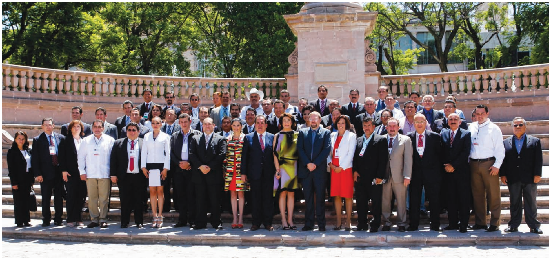
Asistentes a la Conferencia Nacional de Seguridad Pública Municipal

El cansancio por la indiferencia y la violación de los derechos humanos