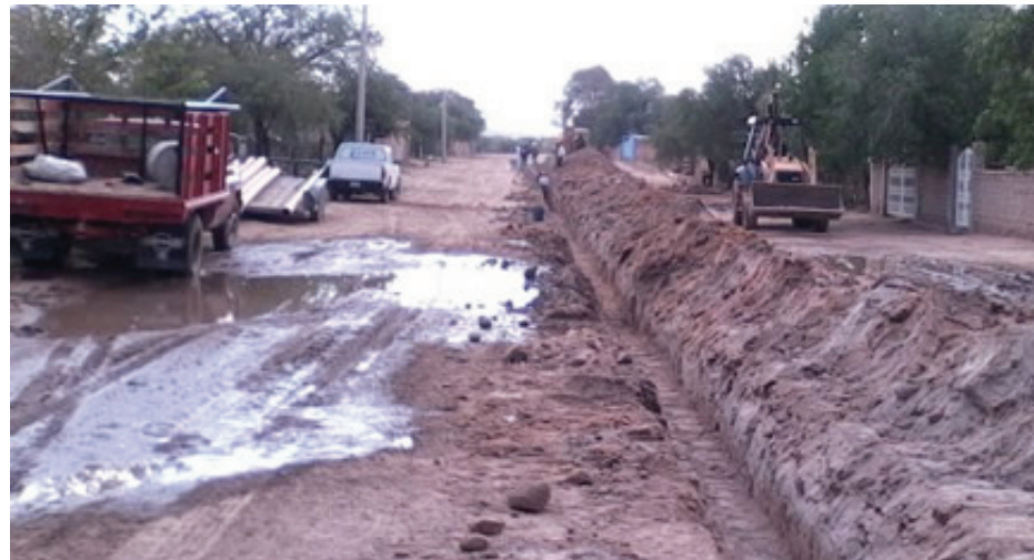
Al estar en servicio se beneficiarán 498 habitantes de la comunidad

Gutiérrez Martínez mencionó que con estos trabajos se atiende una de las más intensas solicitudes, de ahí que el gobierno de Miguel Alonso Reyes, a través de la CEAPA, realice la obra que permitirá a los habitantes contar con un mejor sistema de alcantarillado en este municipio.