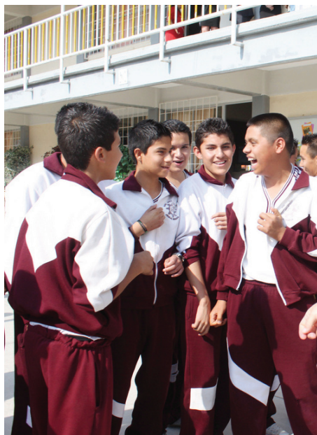
El 98 por ciento de los alumnos fueron ubicados en la primera opción que indicaron en su solicitud