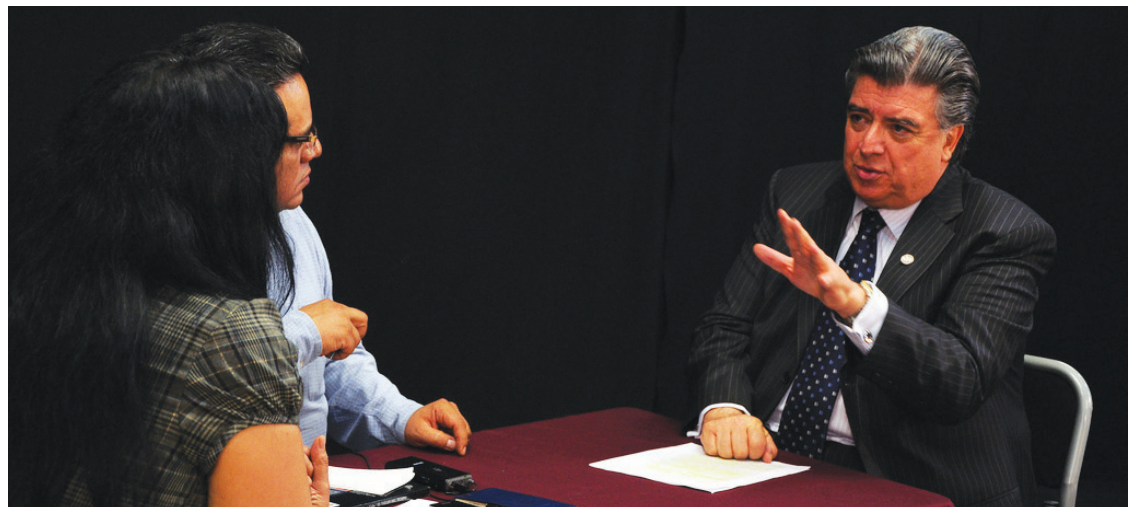
La Ley Electoral tolera el triunfo de quien tenga más dinero a la mano: Felipe González