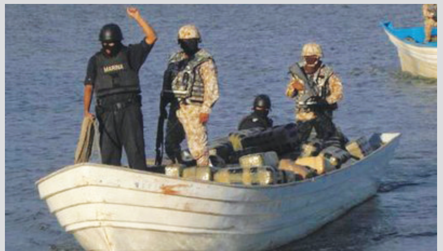
México, DF. Personal de la Secretaría de Marina aseguró ayer más de 3 toneladas 800 kilogramos de marihuana, a bordo de dos embarcaciones menores, en inmediaciones de Isla Huivulai, en el Mar de Cortés.